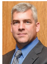
BOB O'DEKIRK Alcalde de Joliet

Un saludo para todos los residentes de Joliet. Al igual que ustedes, me alegro de que se haya terminado el invierno y espero ansioso las temporadas de primavera y verano. Me gustaría dar las gracias a todos nuestros empleados municipales que han trabajado al aire libre durante los meses de invierno, especialmente a las unidades de primera intervención de los departamentos de policía y bomberos así como nuestros equipos del departamento de calles. ¡Buen trabajo!